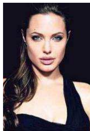
Obrázek 2 Angelina Jolie