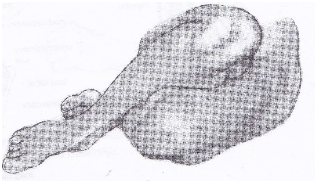
Barrington Barber:Praktický průvodce kreslení – lidské tělo.Svojtka. str.24,25.