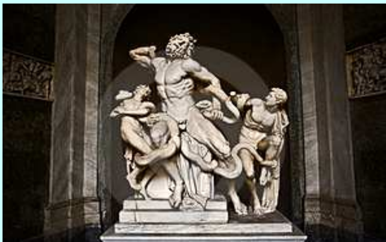
Laokoon a jeho synové, mramor

http://karelsykora.blog.idnes.cz/c/87470/Recke-umeni.html