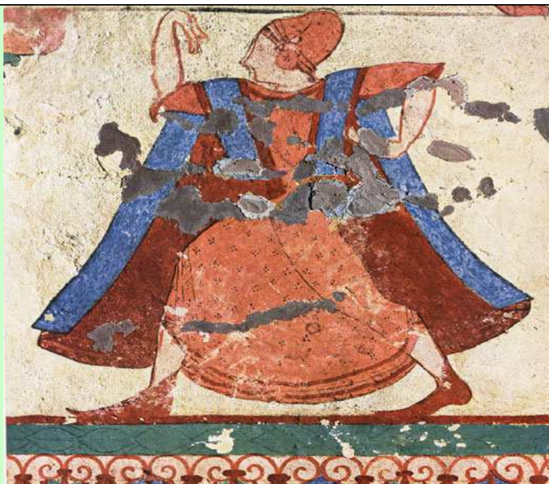
Malba z etruské hrobky

http://zebry.cz/cmelakasvet.cz/?cat=59&paged=4