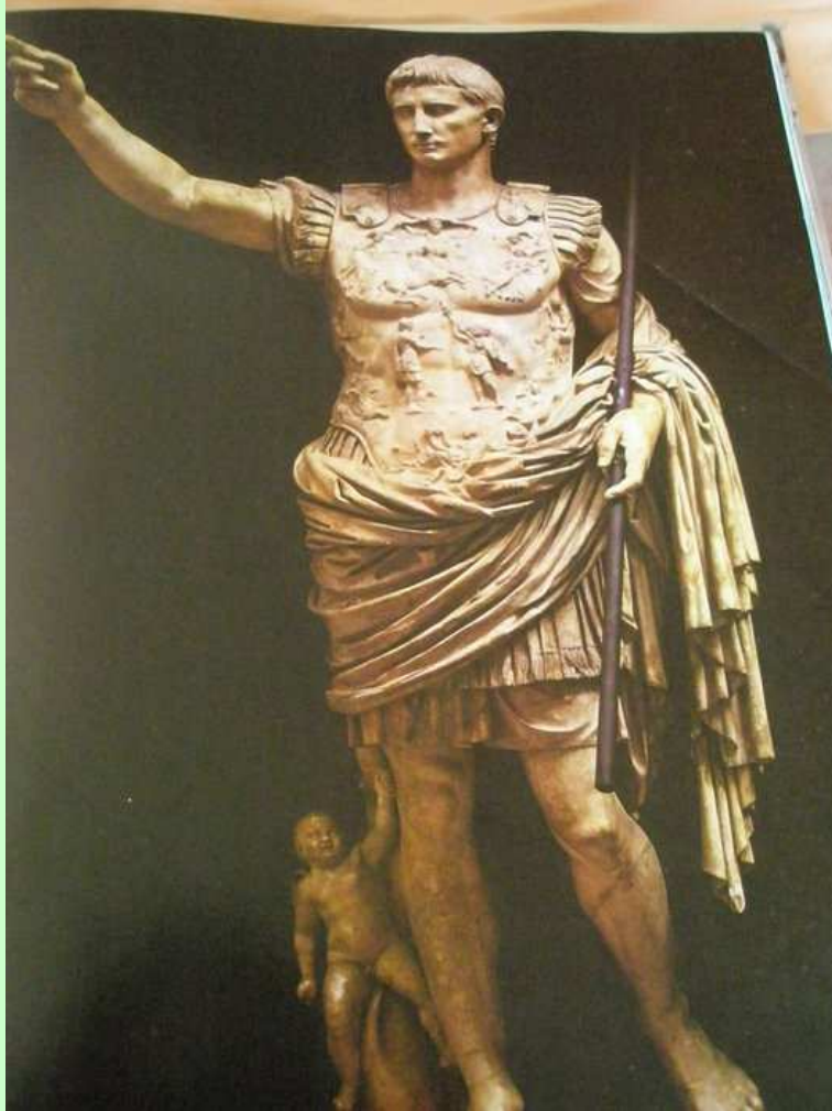
Augustus z Primaorty socha